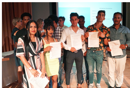
Candidats du PAI santé - volée 2018/2019

Les expériences des candidats et des partenaires se montrent très positives et enrichissantes, tant d'un point de vue humain que professionnel.